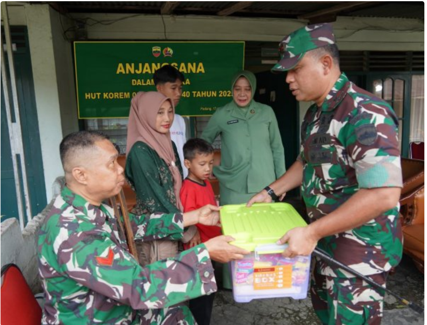
Padang, - Serangkaian kegiatan sosial digelar menjelang HUT ke 40 Korem